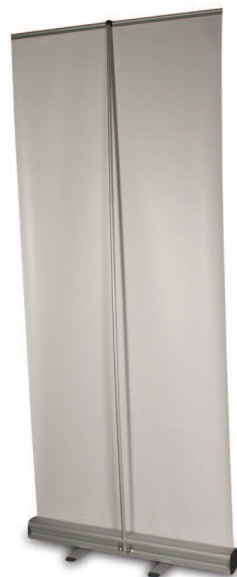
Structure en aluminium avec mât télescopique