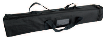
Sac de transport matelassé inclus