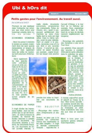
« Petits gestes pour l'environnement. Au travail aussi. » Ubi & hOrs Dit – Journal Interne du groupe Ubiquis

Ubiquis met en oeuvre une politique volontariste en ce qui concerne le développement durable en diffusant des informations dans le journal interne, des notes de recommandations thématiques sur l'usage du papier recyclé et sur le recyclage des piles, sur le bon usage de la bureautique.